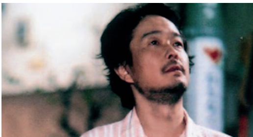
Lily Franky dans All around Us de Ryosuke Hashiguchi (2008)