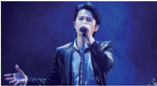
M. Fukuyama en concert à Hong Kong en 2014