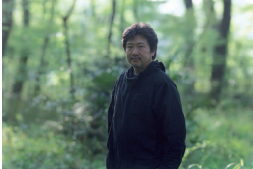
Hirokazu Kore-eda – Mikiya Takimoto/Coll. CdC.