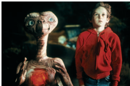
E.T. l'extra-terrestre de Steven Spielberg (1982) – Universal Pictures/ Coll. Cdc